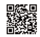
移動図書館詳細 (富士市立図書館ウェブサイト)