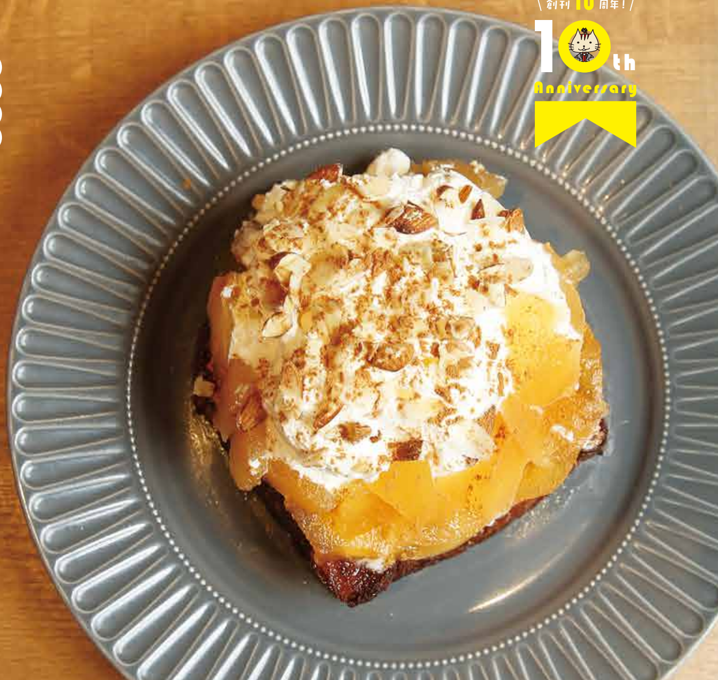
撮影協力: ワンハンドレッドベーカリー 富士店