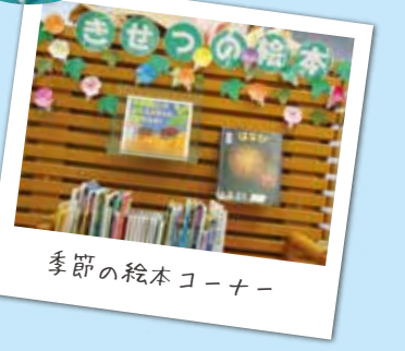
季節の絵本コーナー

西図書館は、JR富士駅に近く、富士市交流プラザ内にあり、平日は午後7時まで開館しています。地域の住民や通勤・通学者が気軽に利用できる図書館です。蔵書は12万7千冊で富士市で2番目に大きい図書館です。 ■ 富士市富士町20-1 (富士市交流プラザ内) ☎ 0545-64-2110