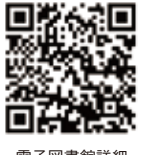
電子図書館詳細 (富士市ウェブサイト)

「ふじ電子図書館」は、図書館で収集しているデジタル化資料を閲覧できるサービスです。インターネットを通じて、パソコンやスマホなどで電子書籍の貸出・予約を行うことができます。貸し出し点数は5点まで。貸し出し期間は2週間です。市内在住・在学・在勤で、利用者カードを持っている方は、カードに記載の8桁の数字を入力して使用が開始できます。利用者カードを持っていない方は、事前に図書館の窓口で作成してください。その他詳細は、富士市のウェブサイトを確認してみてください。