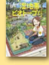
「自宅で湿地帯をビオトープ！生物多様性を守る水辺づくり」 著者：中島洋 出版：大和書局

大淵分室は大淵まちづくりセンター内に併設された、市内で一番富士山に近い図書館です。室内には赤ちゃんと一緒に絵本を楽しめる畳のコーナーがあります。毎月、季節の本などを集めた企画展示も行っています。 ■ 富士市大淵2885-4 (大淵まちづくりセンター内) ☎ 0545-35-0222