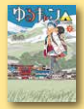
「ゆるキャン△」7巻 著者：あけろ 出版：芳文社

旧富士川町内、富士川橋の近くにある小さな図書館です。富士川ふれあいホールの中にあります。館内にはお話し室があり、小さなお子様連れでも気兼ねなくゆったり本を楽しめます。 ■ 富士市岩淵855-39 (富士川ふれあいホール内) ☎ 0545-81-4814